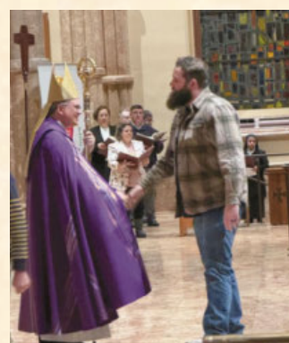
Students from OCIA completed the rite of election at the Holy Name Cathedral. Thank you to Holy Name Cathedral!